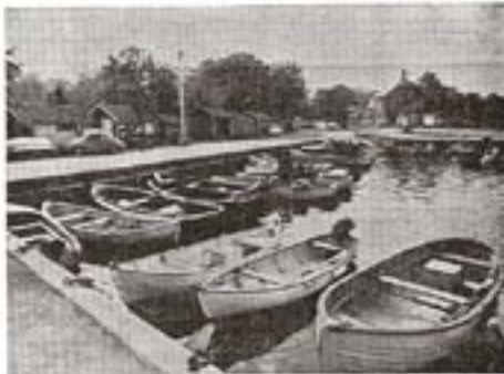
Småbåtshamn i Båstad. Utvärdering om småbåtshamn i Båstad. Utvärderingen ska vara ett steg mot att skapa en riktig småbåtshamn i Båstad.

Skapat ett ny småbåtshamn i Båstad som tillfredsställer kraven för att det ska vara en riktig småbåtshamn, men det är inte alla som är överens om detta. Självklart för en del, men för andra är det inte så enkelt. Det är därför som Båstad kommun har utlyst en utvärdering om småbåtshamn i Båstad. Utvärderingen ska vara ett steg mot att skapa en riktig småbåtshamn i Båstad. Det innebär att det ska vara möjligt att ta tillvara på de många småbåtar som finns i Båstad. Det innebär också att det ska vara möjligt att ta tillvara på de många småbåtar som finns i Båstad. Det innebär också att det ska vara möjligt att ta tillvara på de många småbåtar som finns i Båstad.