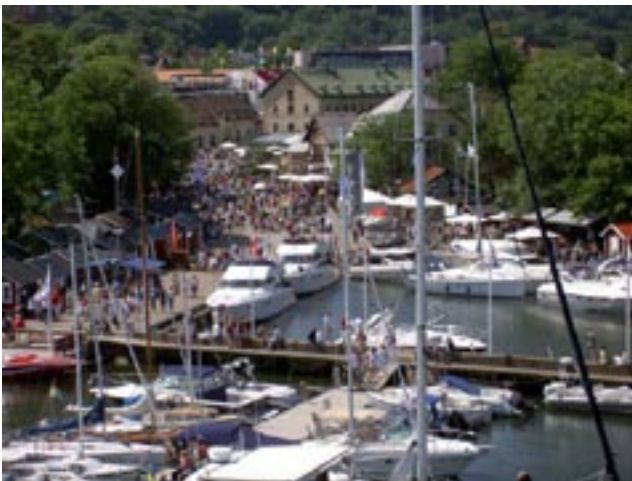
BÅSTAD HAMN 2007