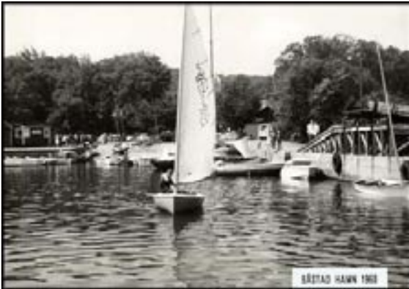
BÅSTAD HAMN 1960